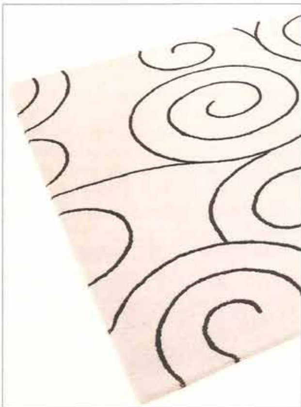
GRÁFICO. O tapete modelo Sarabande , da coleção Première , da Santa Mônica, é feito de náilon Antron 6.6. Em tamanhos sob medida e sem emendas, disponível em 60 opções de tonalidades. Vendido por 575 reais o m 2 .