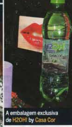
A embalagem exclusiva de H2OH! by Casa Cor